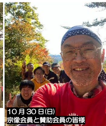
10月30日(日) 宗像会員と賛助会員の皆様