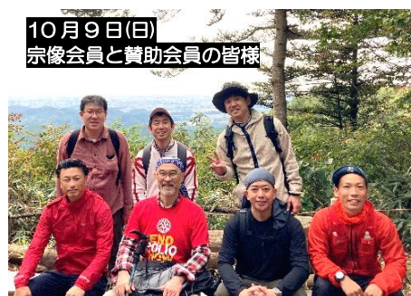
10月9日(日) 宗像会員と賛助会員の皆様

10月9日(日)、23日(日)、30日(日)に「ポリオ根絶チャリティー登山」を開催しました 参加費1,000円/人をポリオデーの寄付金とし、3日間で25,000円集まりました