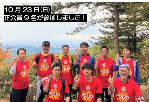
10月23日(日) 正会員9名が参加しました!