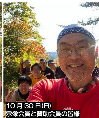
10月30日(日) 宗像会員と賛助会員の皆様