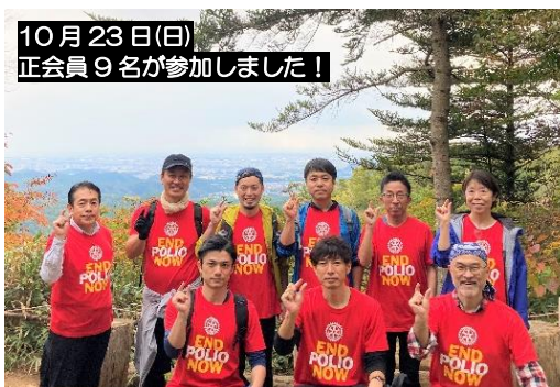
10月23日(日) 正会員9名が参加しました!