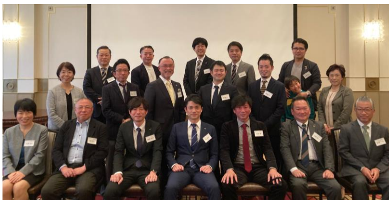
◀第3回総会集合写真