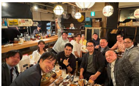
▲4月30日親睦移動例会