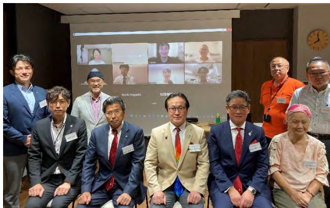
▼9月5日ガバナー公式訪問